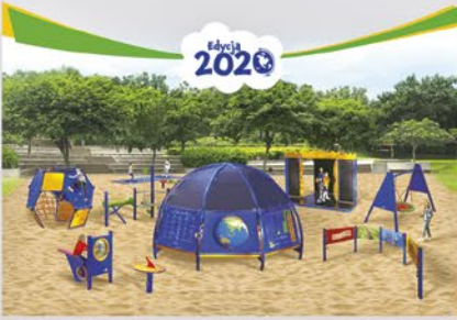
Historia podwórka Nivea w Dobrzejewicach