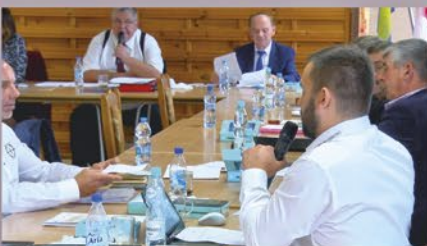
Pierwsza obywatelska inicjatywa uchwałodawcza w gminie Obrowo