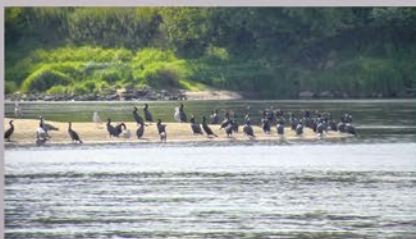
Wisła jako szansa na rozwój gminy