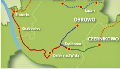
Międzygminny Rodzinny Rajd Rowerowy