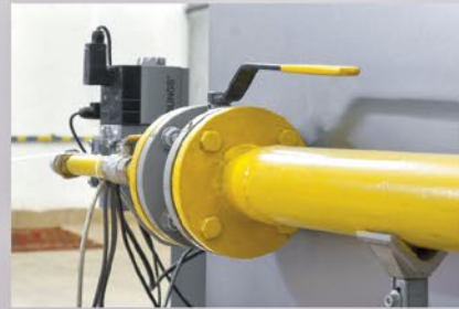
Rozbudowa sieci gazowej